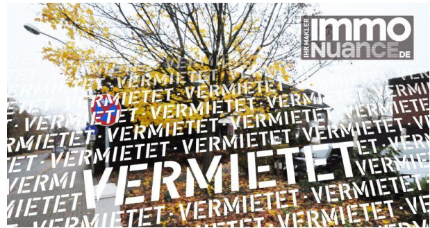
Außenansicht 3,5 Zimmer Miete Vermieten Pinneberg Rellingen Schenefeld Dachgeschoss Immobilien von Stosch