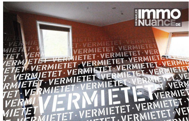
Wohnbereich 3,5 Zimmer Miete Vermieten Pinneberg Rellingen Schenefeld Dachgeschoss Immobilien von Stosch