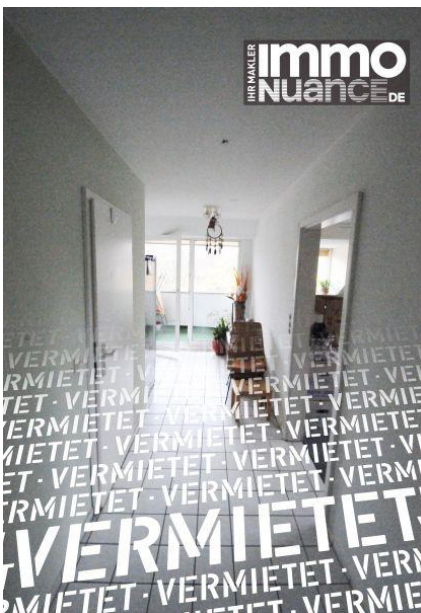
Flur 3,5 Zimmer Miete Vermieten Pinneberg Rellingen Schenefeld Dachgeschoss Immobilien von Stosch