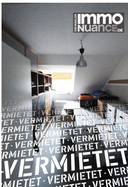
halbes Zimmer 3,5 Zimmer Miete Vermieten Pinneberg Rellingen Schenefeld Dachgeschoss Immobilien von Stosch