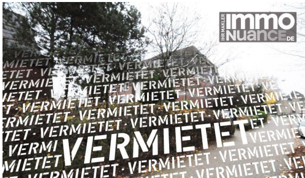
3,5 Zimmer Miete Vermieten Pinneberg Rellingen Schenefeld Dachgeschoss Immobilien von Stosch