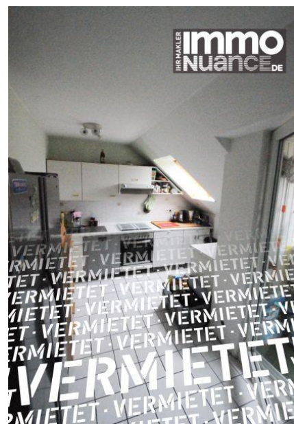
Küche 3,5 Zimmer Miete Vermieten Pinneberg Rellingen Schenefeld Dachgeschoss Immobilien von Stosch