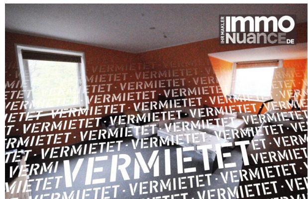
Eltern 3,5 Zimmer Miete Vermieten Pinneberg

Rellingen Schenefeld Dachgeschoss Immobilien von Stosch