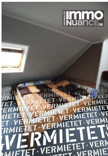
Schlafen 3,5 Zimmer Miete Vermieten Pinneberg

Rellingen Schenefeld Dachgeschoss Immobilien von Stosch