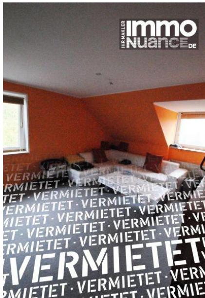
Wohzi 3,5 Zimmer Miete Vermieten Pinneberg Rellingen Schenefeld Dachgeschoss Immobilien von Stosch