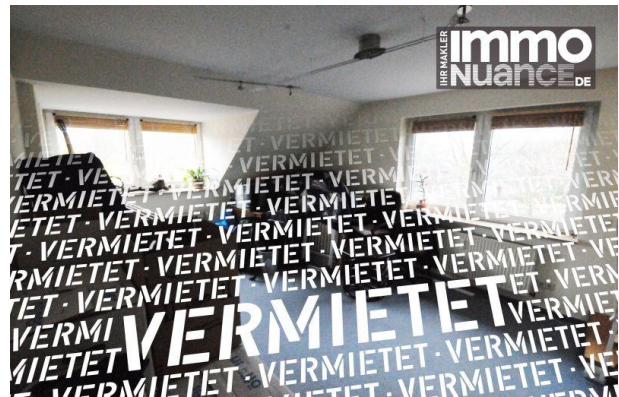
Wohnen 3,5 Zimmer Miete Vermieten Pinneberg

Rellingen Schenefeld Dachgeschoss Immobilien von Stosch