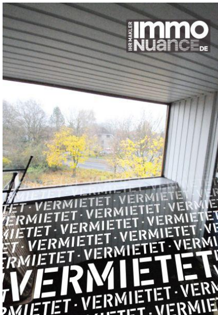
Loggia 3,5 Zimmer Miete Vermieten Pinneberg

Rellingen Schenefeld Dachgeschoss Immobilien von Stosch